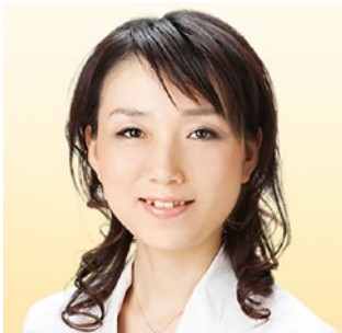
桑島内科医院 副院長 新宿溝口クリニック 栄養療法医師